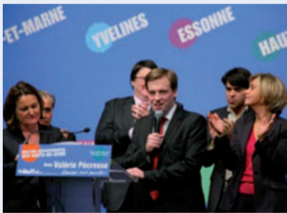
Régionales 2010 : grande réunion publique à Issy-les-Moulineaux avec Valérie Pécresse, André Santini, Roger Karoutchi et Christine Lagarde.