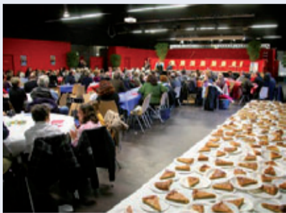
plus de 200 Clamartois(es) à l'occasion de la galette 2010 d'écouter pour Agir.